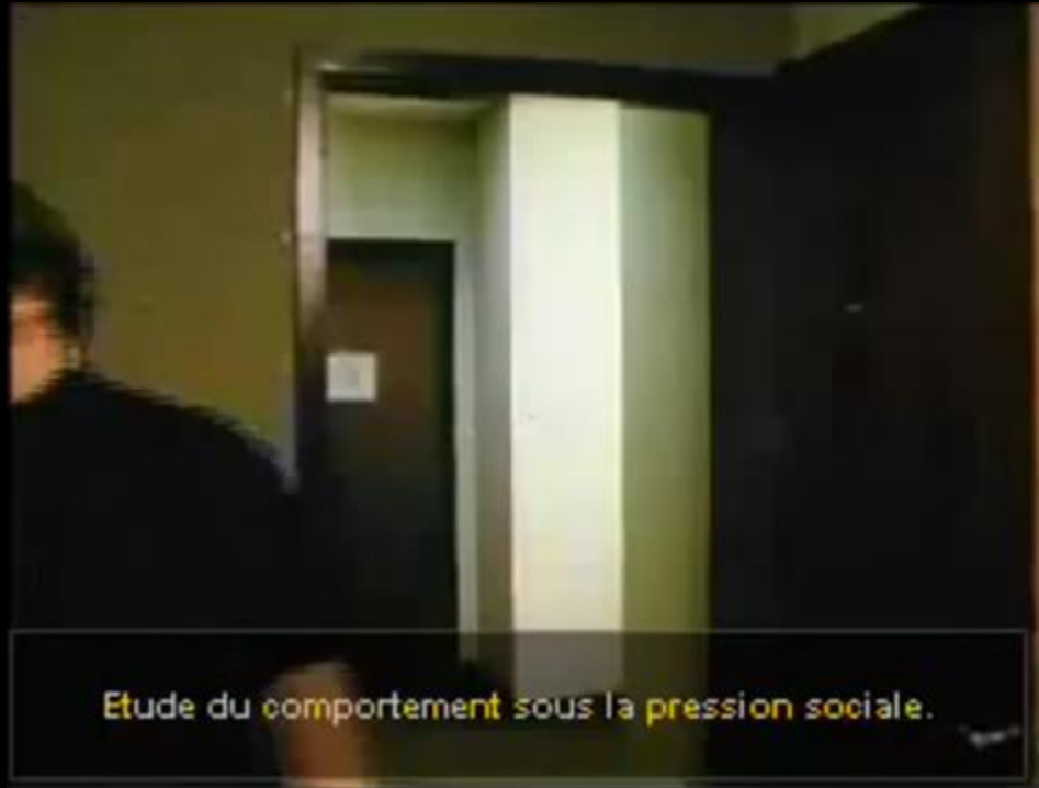
Vidéo de l'expérience d'Asch